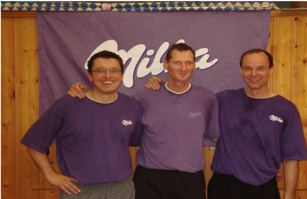
Die tapferen 2. Sieger : BA/1